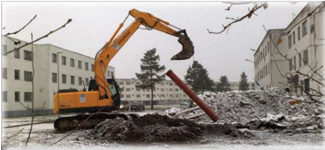
Строительные работы в Пюсси должны завершиться к Рождеству. Восстановительные работы будут сдвинуты на следующий год.